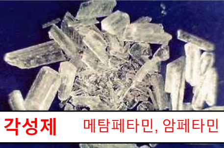
각성제 메탐페타민, 암페타민

*일본 내 대마초 사용과 일본으로부터의 신중 향정신성 물질(NPS) 수출은 현행법상 금지되어 있지 않습니다.