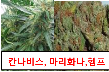
칸나비스, 마리화나, 헴프